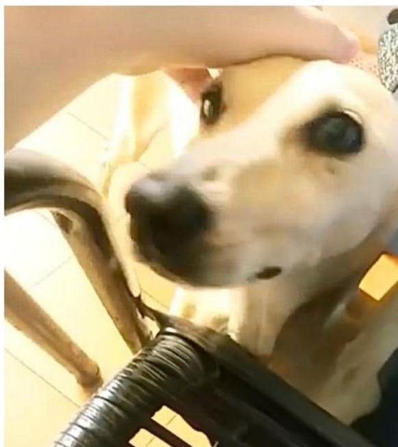
A única foto...