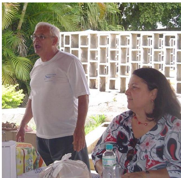
Piracicaba – Páscoa 2018

Nestas alturas da coluna... sabem o que descobri?