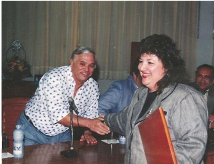
Título de Cidadã Benemérita