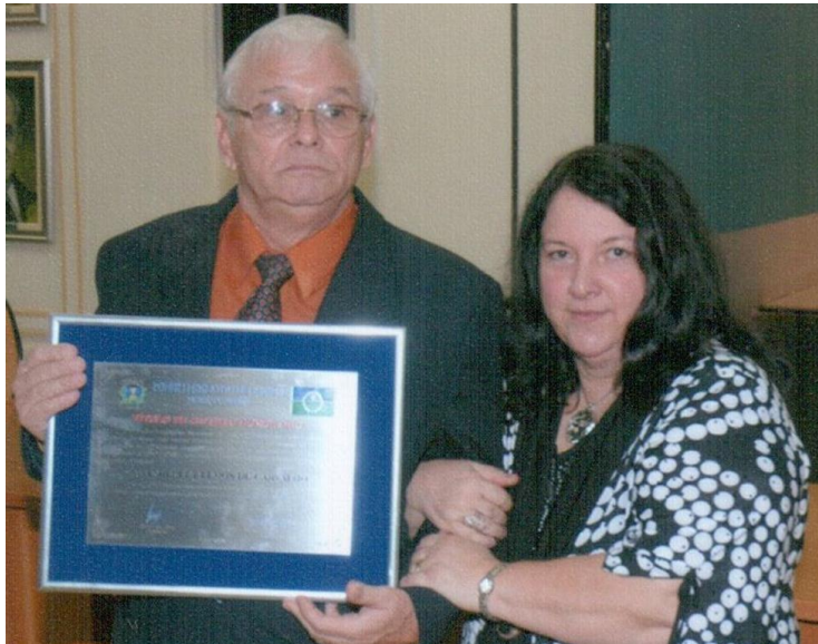
Título de Cidadão Honorário