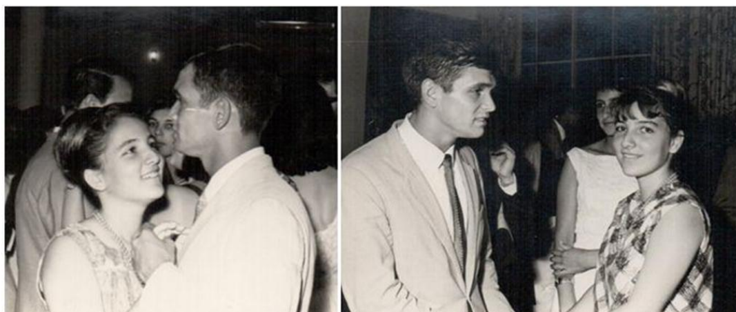
SÃO CARLOS - Associação Dos Alfaiates – Namoro - 1963