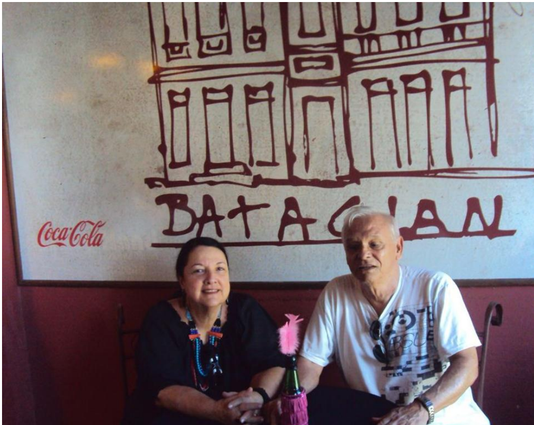
Ilhéus – BA – Bataclan - 2015