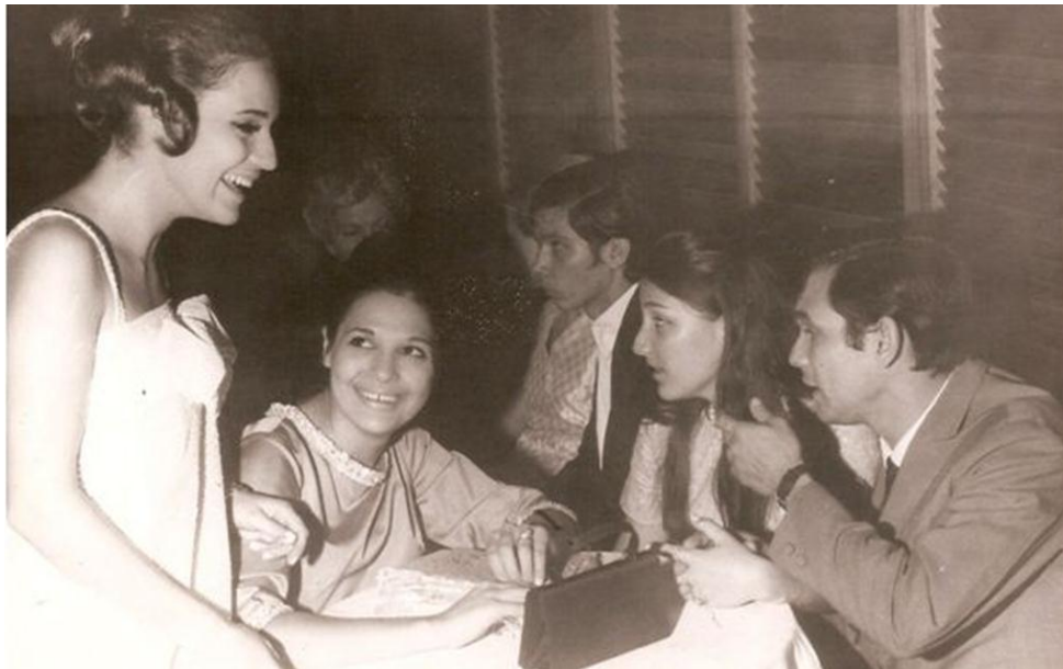
Formatura do colegial – 1968