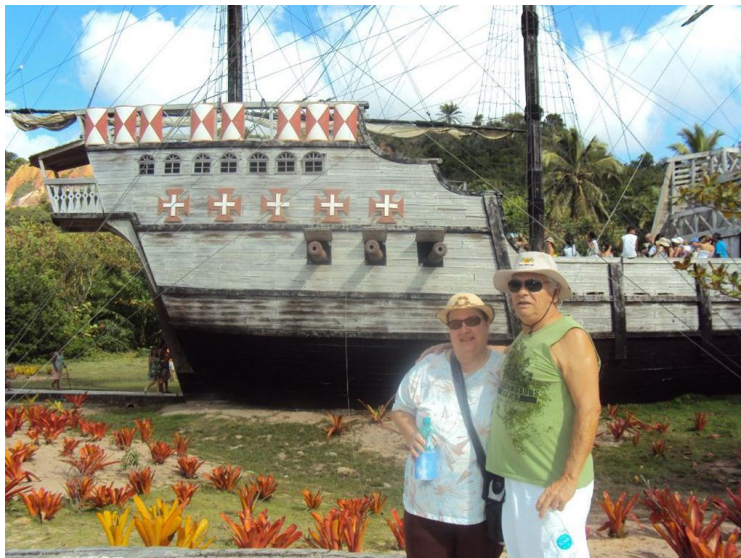
Porto Seguro – BA – 2011