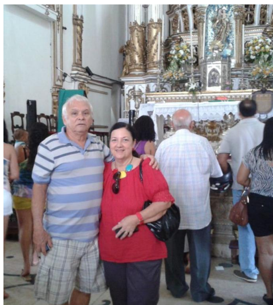
Salvador – BA – Igreja do Bonfim – 2014