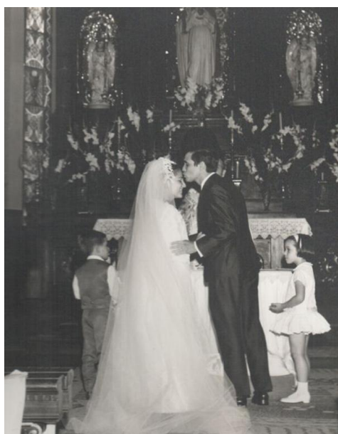
O casamento – 1969