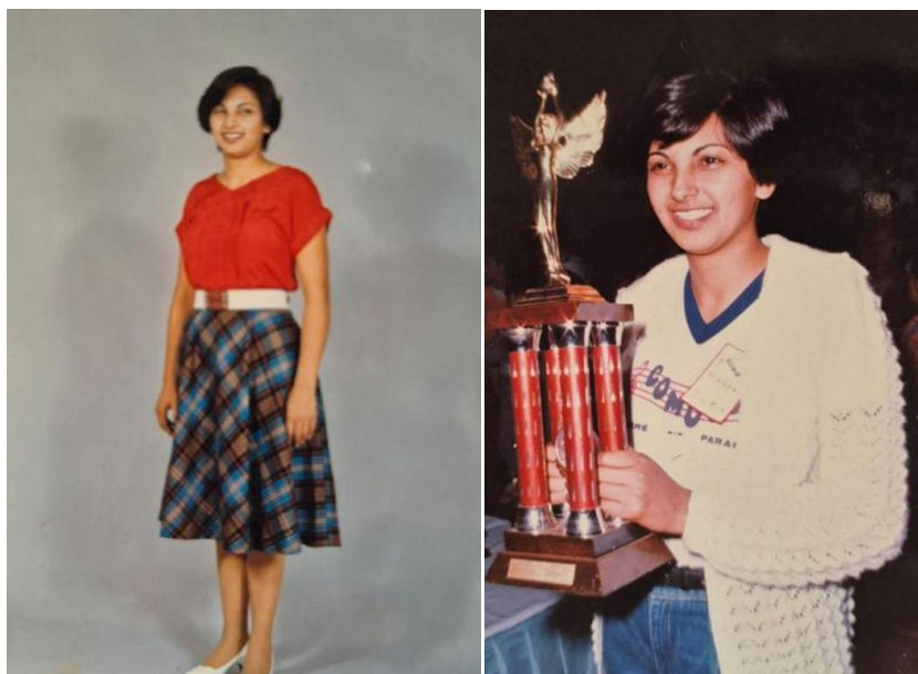
Era assim quando foi minha aluna...