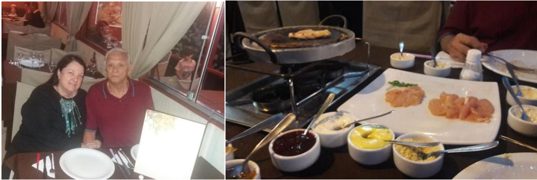
Fondue em Gramado – Maison du Saveurs – 2017