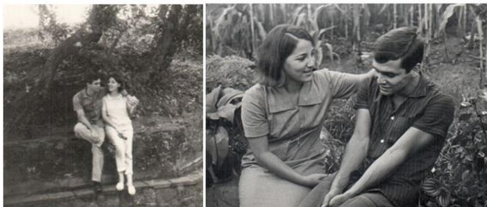
Namoro – não sei o ano