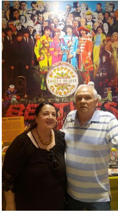
Museu dos Beatles - Gramado - 2016