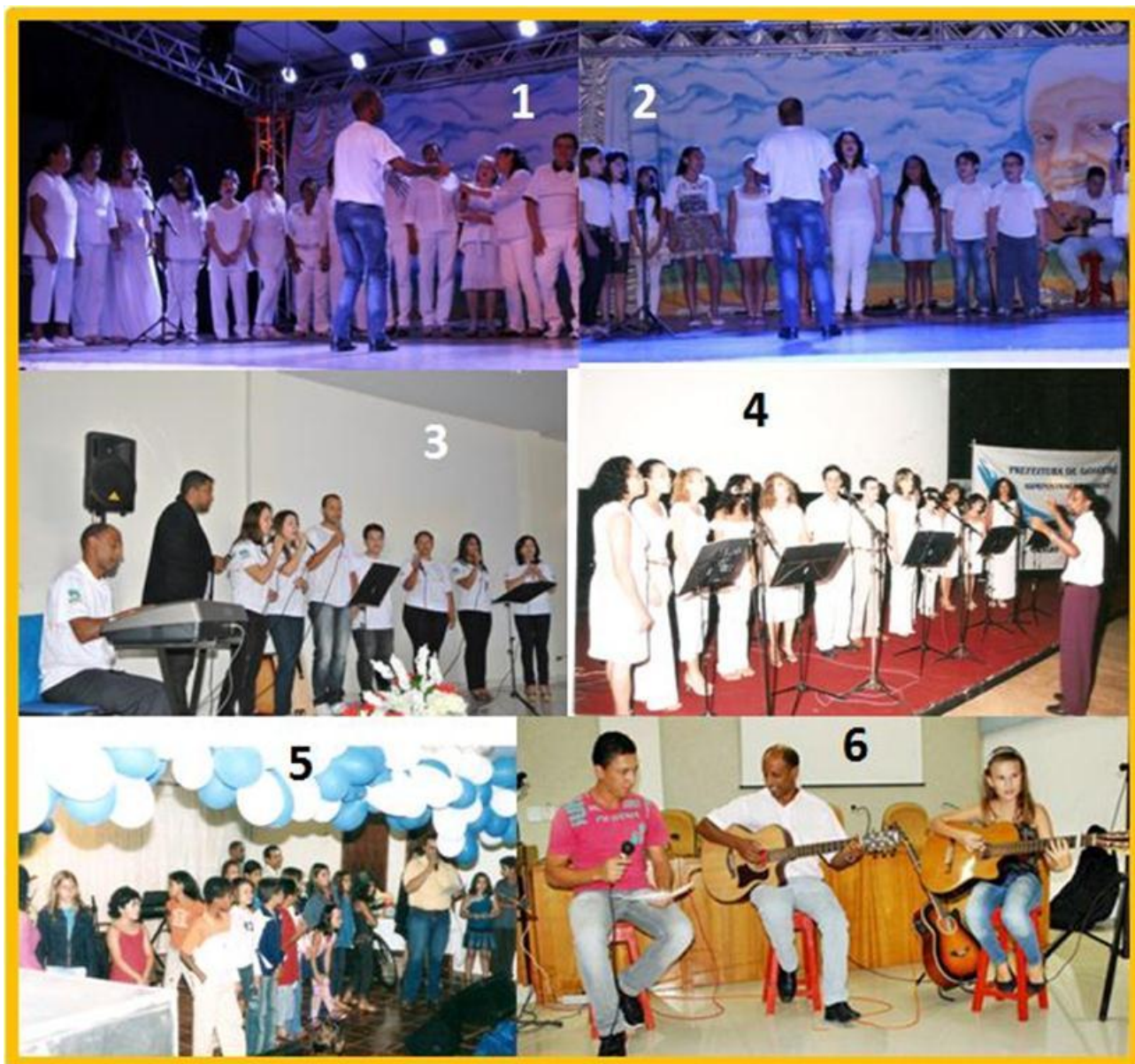
1 e 2 – Projeto Cultura exalta Caymmi 3 – Grupo vocal na reunião da Regional de Cultura 4 – Alunos de Técnica Voca - 2002