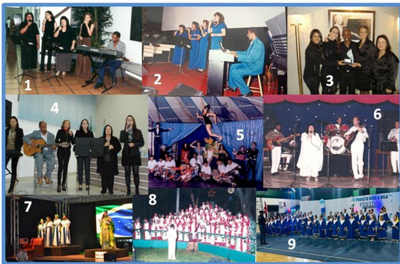
1 a 4 – Quarteto feminino 6) Os primeiros shows Ontem ao Luar 8) Coral infantil Pequenos Cantores

Do quarteto feminino participei por mais de 30 anos. Foi ali que constatei de vez o dom do nosso maestro. Era IMPRESSIONANTE a facilidade que ele tinha (tem!) de ajustar cada voz... cada harmonia. Assim, “do além”... procurando no teclado, na maioria das vezes, ou no violão.