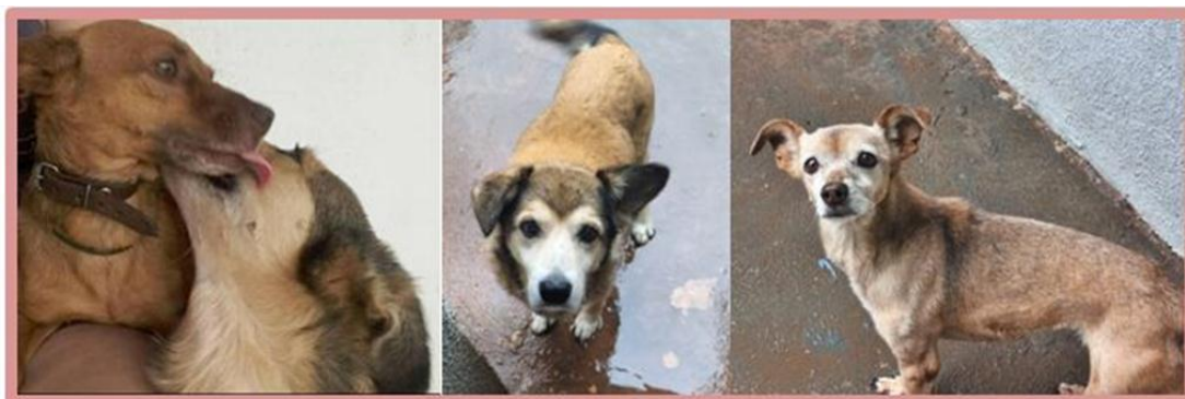
O "distinto" casal...