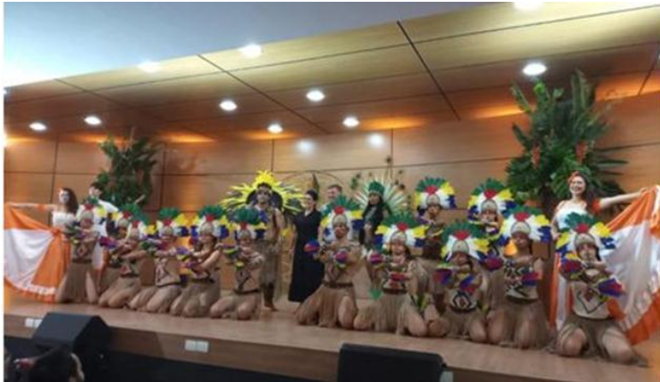
Conferência Estadual de Cultura

O Grupo de Dança Pé Vermelho já representou a cultura popular brasileira na Conferência Estadual de Cultura realizada em Foz do Iguaçu e em apresentações na Secretaria de Estado da Cultura do Paraná, em Curitiba.