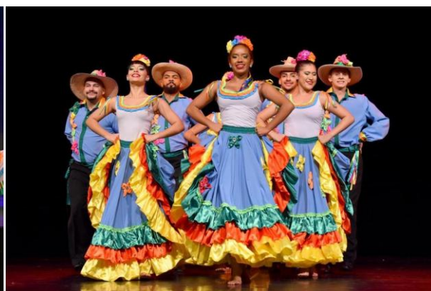
Atualizada – saias com 10 metros!