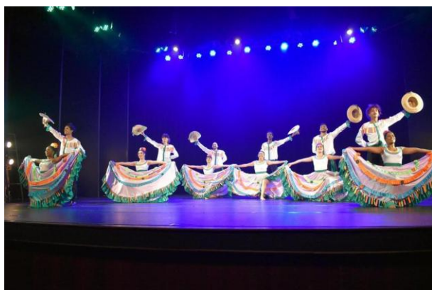
Dança Do Siriri da estreia– saia com 3 metros (falta de verba...)

Quando eu vi a primeira vez em que se apresentaram como grupo de dança, no XVIII FEMUG, tive a certeza de que eu não estava enganada! Era, realmente, um grupo MARAVILHOSO! Coisa de profissionais!