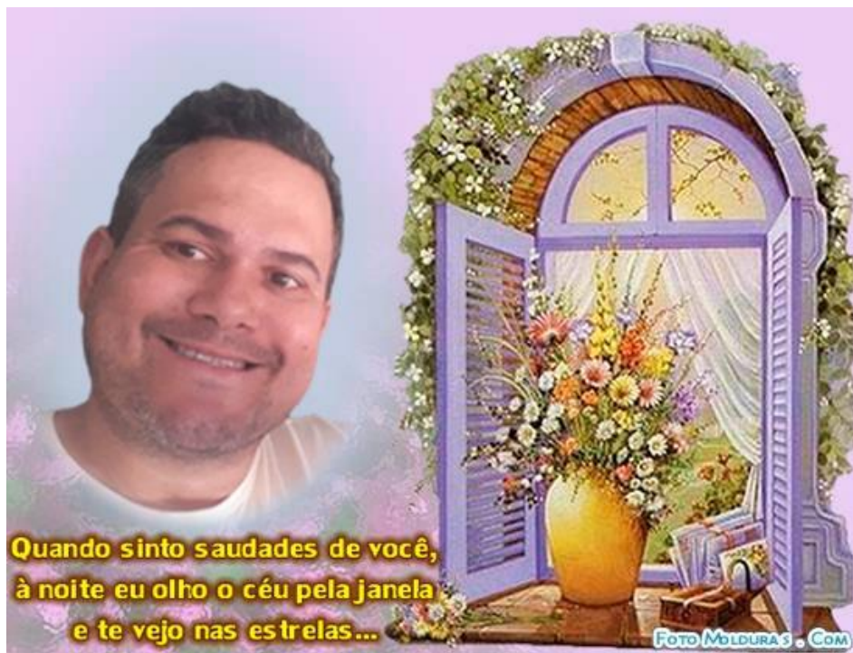
(Arte de Gabriel Martins)

Ah, garoto! “E agora, José?” O que fazer com este vazio que deixou em todos??