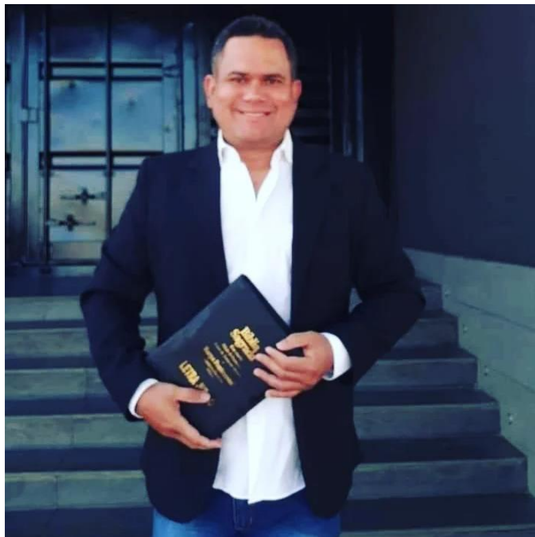
A pessoa séria em que se transformou!