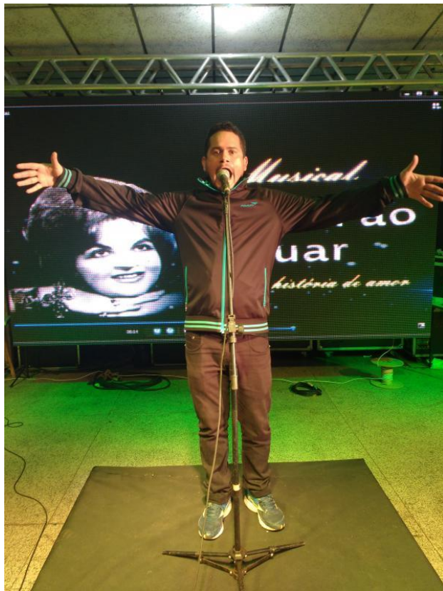
Ensaio geral do Ontem ao Luar