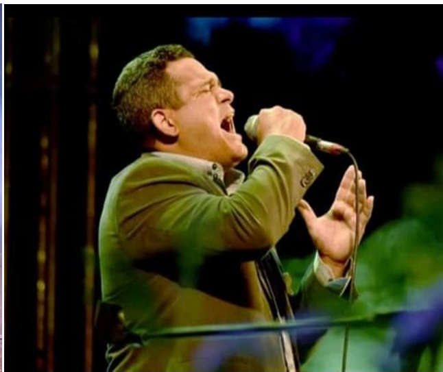
Isso é cantar com alma. Sentir a música!