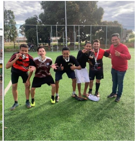
e entrega para ao pupilos também!