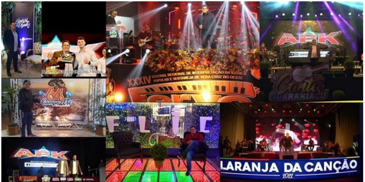
Uma pequena parte das cidades