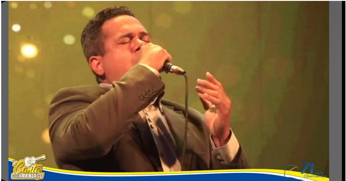
Talento que vem do “âmago!”