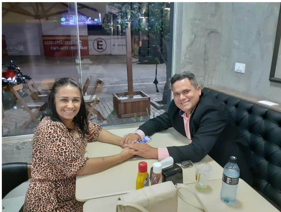
Companheira de vida!