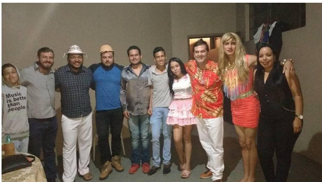
ARRETADOS - 2017