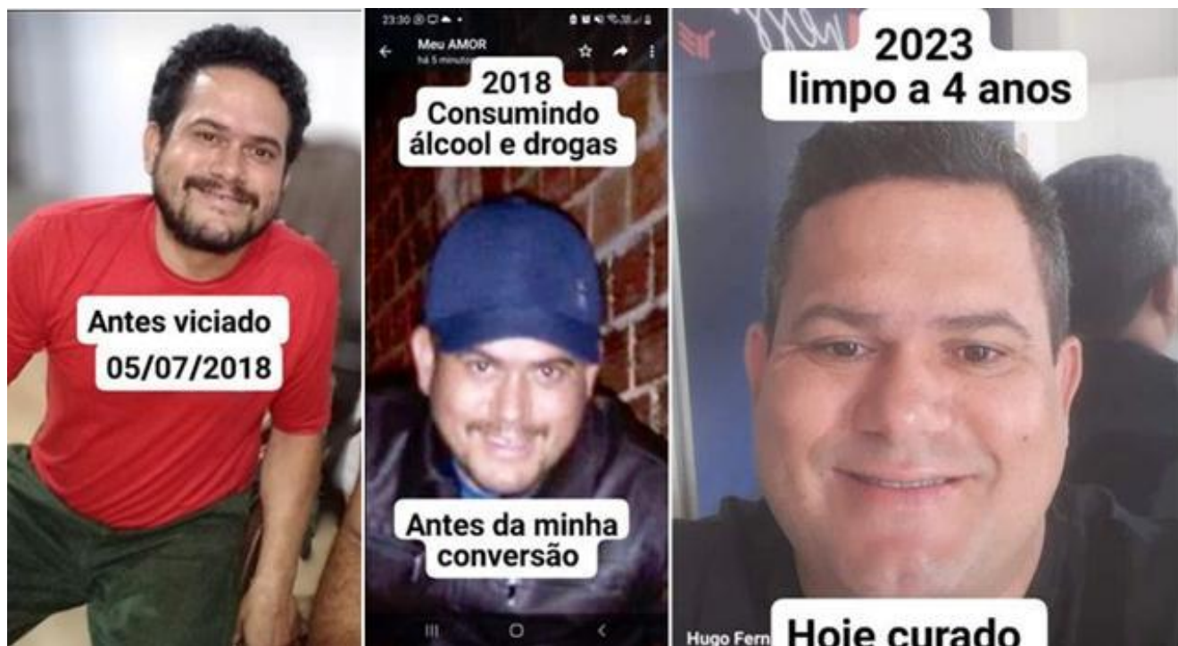
Observem o olhar das primeiras e o de paz da última!

Dos tropeços na vida todos souberam – senão antes, agora. Ele nunca escondeu! Pelo menos, nunca depois que tomou consciência. Estas fotos peguei do perfil dele do face: