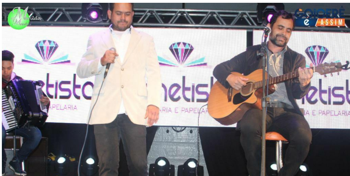
Na mesma festa