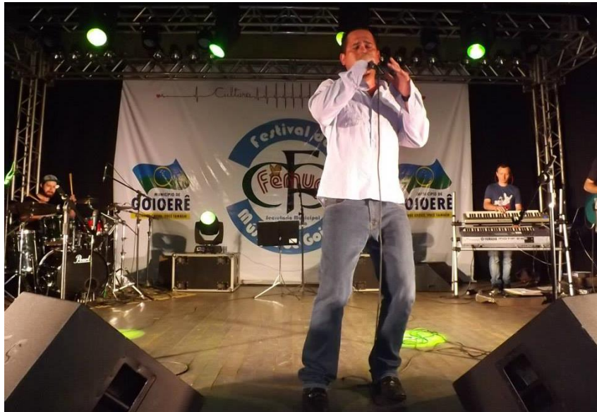
FEMUG – 2º COLOCADO MPB