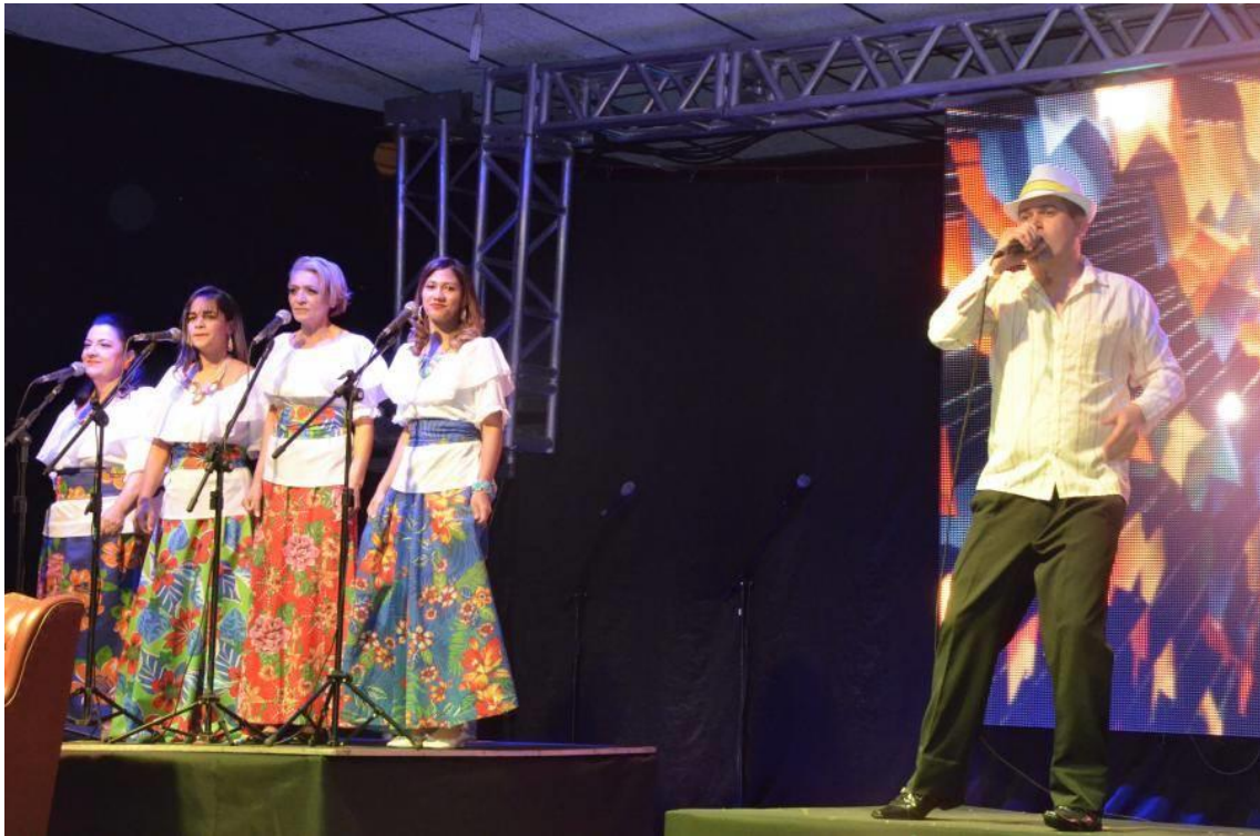
No nosso Ontem ao Luar