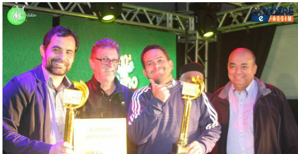
10ª Festa do Milho