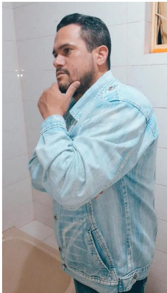
Pensando em quê? Em como era lindo?(Ou... “ta na hora de fazer esta barba...”?)