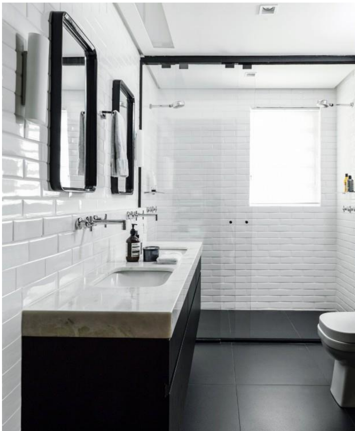
Banheiro. Paredes cobertas com azulejos da linha Metrô, da Portobello, e piso de porcelanato preto dão a base para o espaço, que tem bancada de mármore Carrara e espelhos com moldura de madeira laqueada preta