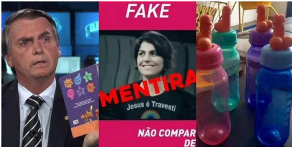
Bolsonaro com o Kit Gay, Manuela D'Ávila com uma montagem na camisa e as mamadeiras ajudaram a definir o rumo das eleições

Uma das fake news mais disseminadas em 2018 já circulava pelas redes sociais quando foi reforçada por Jair Bolsonaro. O então candidato a presidente pelo PSL mostrou o livro "Aparelho Sexual e Cia" em entrevista ao Jornal Nacional, em 28 de agosto de 2018, afirmando que ele faria parte de um "kit gay" distribuído a escolas durante os governos petistas.