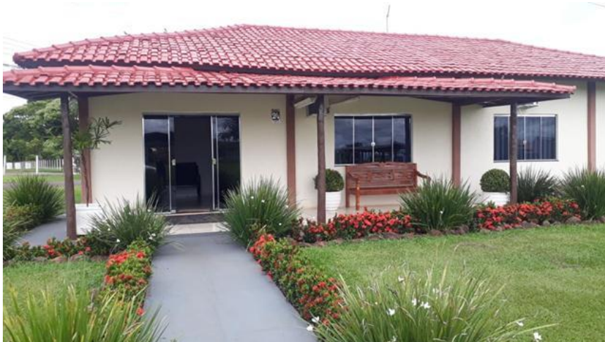
Visitas in loco, mais tarde...